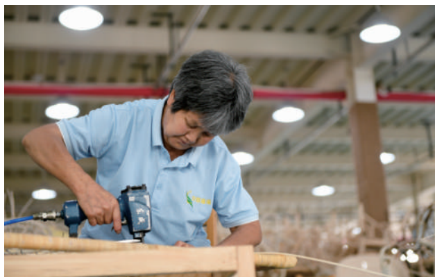
汉中市一家编织工厂内，工作人员在加工工艺品

正是在国家的保驾护航之下，零工经济不断壮大。公开信息显示，预计到2035年中国“零工经济”的GDP占比将达到6.82%，到2036年零工经济从业者将达到4亿人，将形成亿万级的蓝海市场。