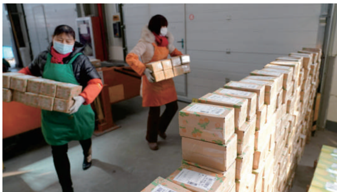
武功县陕西美农网络科技有限公司物流仓，工作人员堆放快递包裹