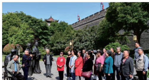
自乐班在西安城墙下演唱《八百里大秦川》

在西安，自乐班通常指自发组织起来的非专业戏班。从环城公园的树下到空旷广场的一隅，在晨光冉冉升起之前，或夕阳将落未落之时，只要抑扬顿挫的板胡声一起，随后便是破空而出的一嗓子，撞上高耸的城墙，又“振聋发聩”地四散开来。